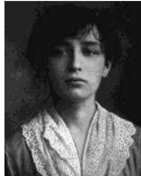
Camille Claudel în 1884

Nu doar Camille a fost modelul lui Rodin? Uneori rolurile se inversau, iar sculptorul devenea subiectul de studiu al artistei. Privind capul statuetei care surprinde mișcarea pictorului, ne dăm seama că modelul a fost de fapt Rodin. Artistul a fost redat într-o manieră caricaturală, cu barba mare și părul înfioat.