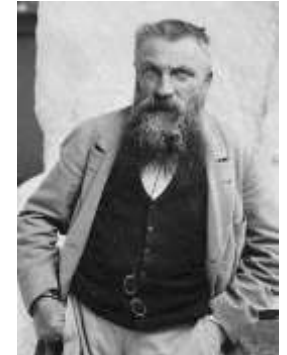
August Rodin în 1898

Torsul de femeie este o lucrarea care prezintă fragmentar un corp feminin aflat în mișcare. Lucrarea a fost realizată sub influența lui Rodin care a observat privind statuile antice, păstrate doar fragmentar, că nu este necesară o reprezentare a întregului corp pentru a reda mișcarea. Ce părere ai? Privind fragmentul poți să te așezi în aceeași poziție? Notează care este piciorul pe care crezi că modelul și-a sprijinit greutatea